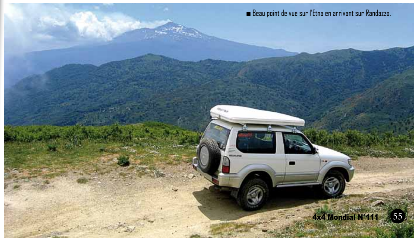
■ Beau point de vue sur l'Etna en arrivant sur Randazzo.

splendide façade est encadrée par des colonnes corinthiennes. Mais la journée s'étire et il faut bientôt repartir pour rejoindre Syracuse. Ce soir hébergement à l'hôtel pour tout le monde. Hélas, ce n'est pas du tout l'ambiance des soirées précédentes. L'hôtel est confortable avec ses 3 étoiles et sa piscine d'un autre monde, mais nous sommes littéralement noyés dans la masse des touristes de tous horizons qui sont venus là par cars