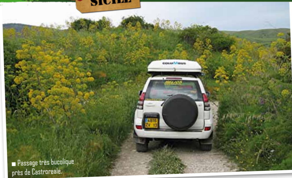
■ Passage très bucolique près de Castroreale.

Le lendemain, nous nous dirigeons sur Agrigente pour y visiter l'incontournable vallée des temples. Premier contact avec la Grèce antique, premiers moments d'émotion devant ces superbes temples dédiés à Zeus, Héraclès, Héra, et d'autres divinités mineures.