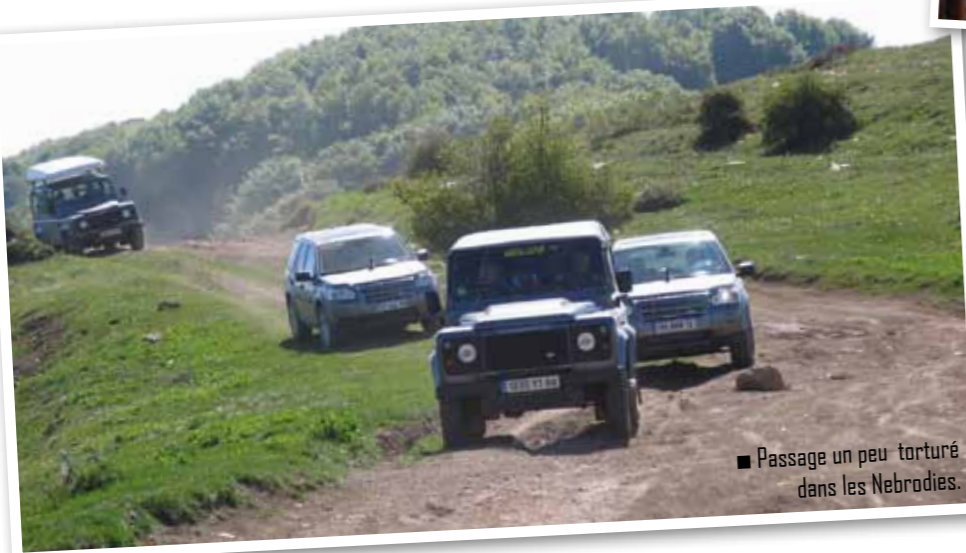
■ Passage un peu torturé dans les Nebrodi.

pas de coulée de lave aujourd'hui mais le déplacement valait la peine malgré ces rafales de vent qui nous congèlent (il fait -3°). Le guide n'a pas besoin de nous presser pour redescendre. La température a encore chuté et le vent s'est chargé d'une neige fondue qui nous transperce littéralement malgré nos vêtements imperméables. Aussitôt arrivés à Sapienza, nous nous précipitons vers les voitures et nous mettons le chauffage à fond. Pour