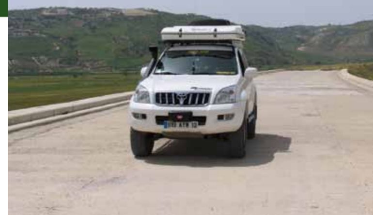
■ L'autoroute «oubliée». Une séquence particulièrement insolite et déjeuner au frais à l'abri d'un tunnel qui abouti dans un champ.