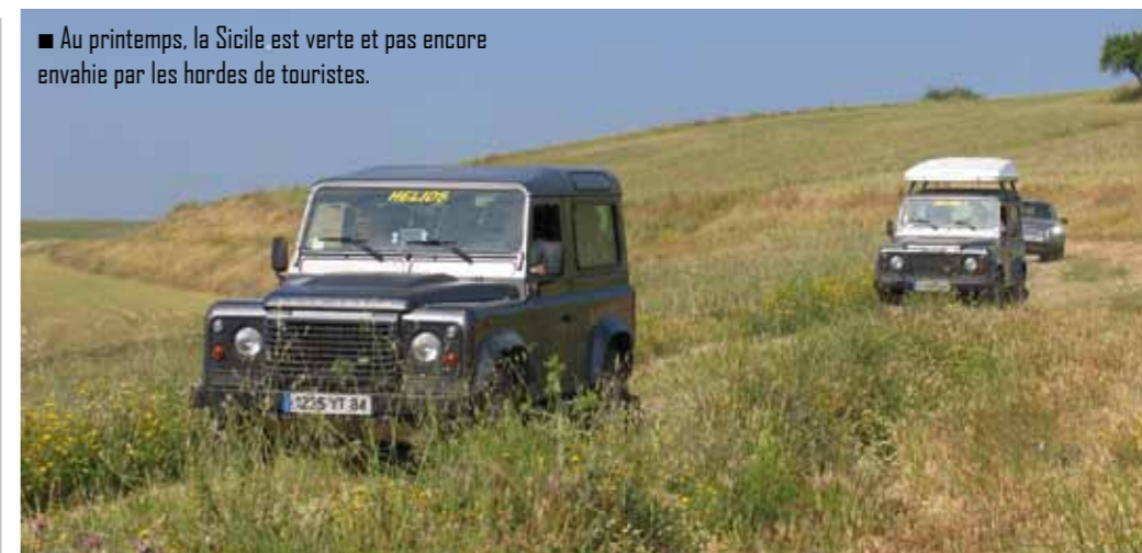
■ Au printemps, la Sicile est verte et pas encore envahie par les hordes de touristes.

ouvrages, devant ces églises majestueuses qui semblent sortir tout droit de l'imagination d'un poète halluciné. Car il y a de la poésie dans le baroque. De la poésie et aussi une certaine mélancolie. Même ceux qui d'ordinaire ne sont pas réceptifs à l'architecture du passé, restent longtemps en contemplation face au portail monumental de la basilique de San Giorgio. Et ce sont encore ceux là qui reviennent sur l'église de San Giuseppe dont la