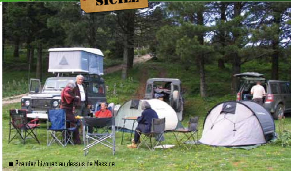
■ Premier bivouac au dessus de Messina.

Au petit matin, nous prenons la route en convoi pour nous rendre sur l'Etna et rejoindre le refuge de Sapienza d'où nous attend un bus 4x4. L'Unimog nous amène 400 mètres plus haut et nous continuons à pied avec un guide tunisien qui parle le français à merveille. 30 minutes de marche dans la neige et le verglas nous amènent au pied du cratère principal. Nous sommes dans un autre monde, un monde minéral où le sol noir est recouvert de neige et où la végétation n'existe plus. Le spectacle est absolument dantesque. Nous ne verrons