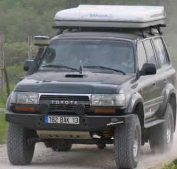
■ Premiers tours de roues sur la piste dans un parc national au dessus de Corleone.