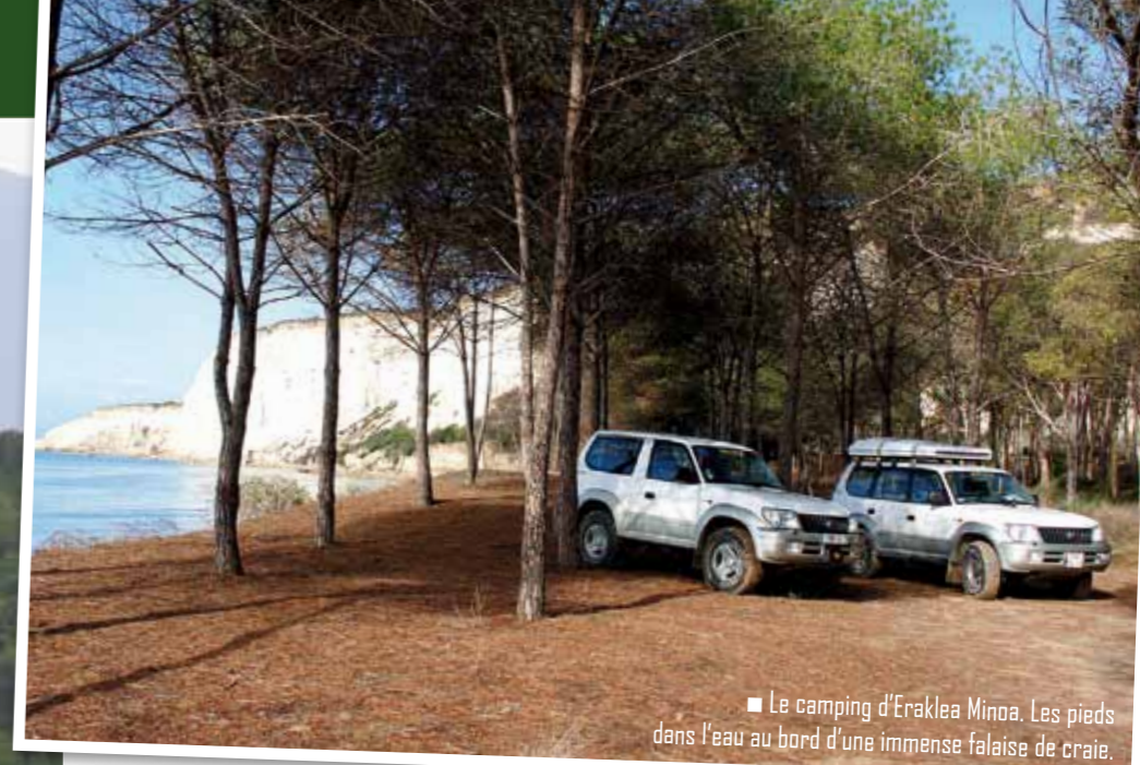
■ Le camping d'Eraklea Minoa. Les pieds dans l'eau au bord d'une immense falaise de craie.