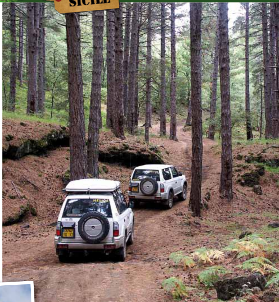
■ La forêt etnéenne et ses arbres endémiques.

■ Petit exposé de volcanologie au pied d'une ancienne coulée de lave.